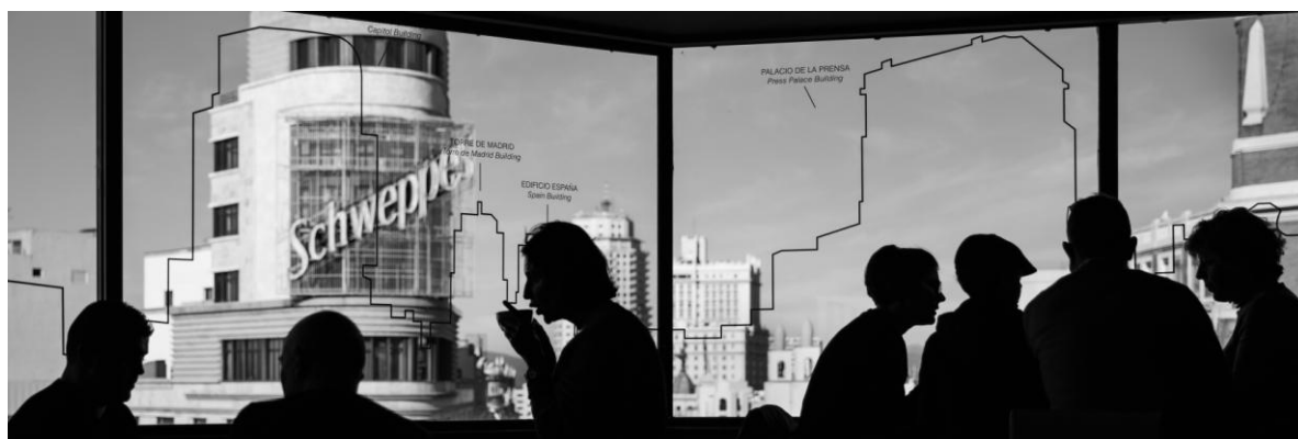
Fotografía ganadora de la III edición. Madrid en blanco y negro. Autor: José Ramón Luna de la Ossa (Tarancón, Cuenca)